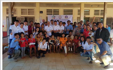
Plastische OP nach Verbrennung