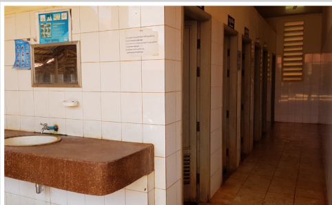
Sanitärbereich des Krankenhauses