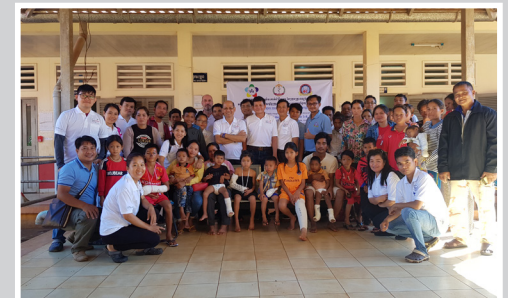
Team und Patienten