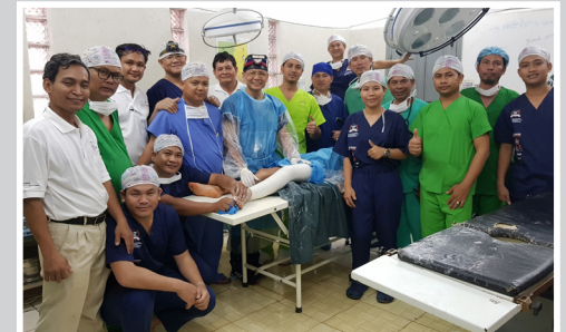
Unser letzter Patient